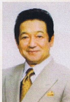
講師 TVキャスター 草野仁氏